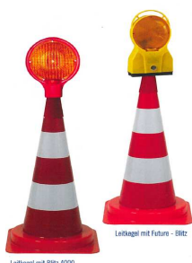
Leitkegel mit Blitz 4000

Wir bieten Ihnen mehr als 30.000 Produkte aus dem Bereich der Verkehrstechnik und Stadtraumgestaltung – fragen Sie uns, wir beraten Sie gerne!